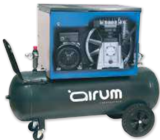
SILBOX B3800/100 CM3

Airum 3 hp caldera 100 lts. 390 lts./min. 230V II 10 bar. 69 dB(A).