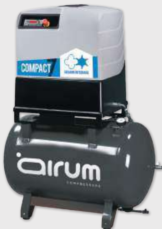
COMPACT 7-270 ES

Airum 10 hp caldera 270 lts. 1000 lts./min. 400V III 10 bar. 67 dB(A)